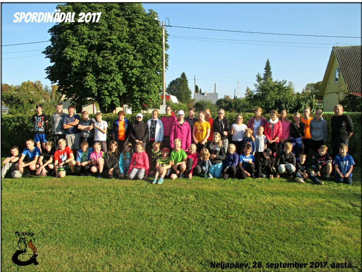
Neljapäev, 28. september 2017. aasta...