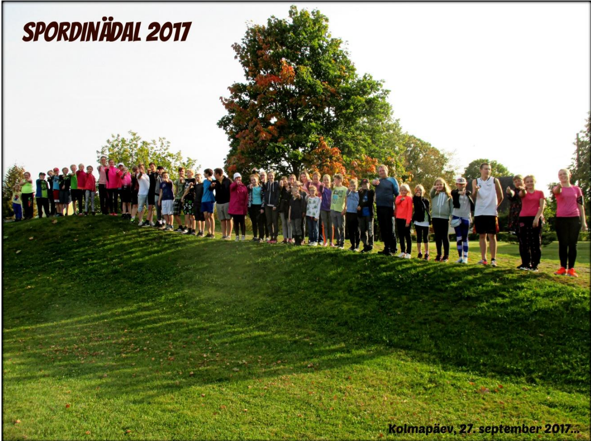
Kolmapäev, 27. september 2017...